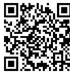
新生暨轉學生專區

八、本校自 100 學年度起校區全面禁菸，推動無菸校園環境。為了您我的健康，請勿在校園內吸菸。凡違反本校菸害防制規定者，依校規將處以「小過」處份，並應參加菸害防制教育。