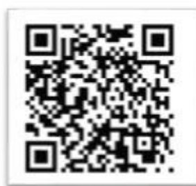
學生學務資訊系統